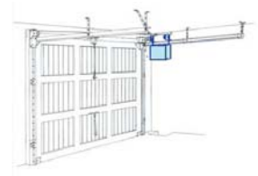
ROB 715 ou votre propre fabrication