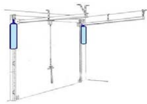
ROB 714 ou votre propre fabrication